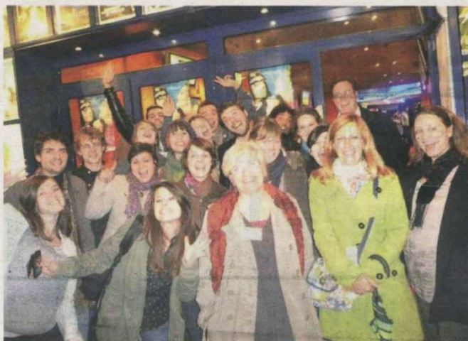
Cette année, 43 bénévoles font vivre le festival.

Sans eux le festival n'irait pas bien loin. Les bénévoles sont la cheville ouvrière du festival. Leur mission, ils l'accomplissent pas amour du cinéma et pour l'ambiance.