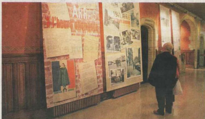
Samedi, de nombreux Arrageois sont venus découvrir l'exposition

Des images inédites permettent de découvrir la vie des