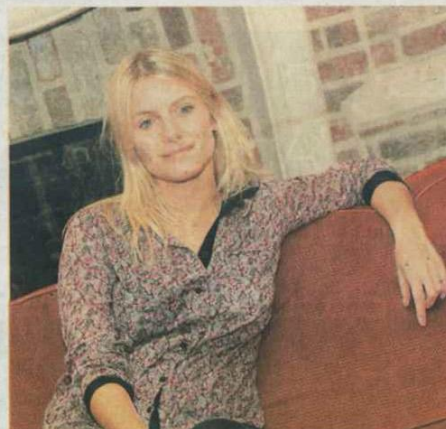
Mélanie Laurent prend plaisir à présenter son premier film en tant que réalisatrice.

Un film qui relate la vie de trois femmes. Liza élève seule son fils. Elle habite en compagnie de sa mère et de sa sœur adoptive, Marine, avec qui elle entretient une histoire fusionnelle. Alors le jour où Marine rencontre Alex et en tombe amoureuse tout vacille. Et tout effondre le jour où Marine est victime d'un accident. Une histoire entièrement